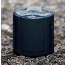
Sensor zum Eingraben

Material: Verzinkter Stahl, 6 mm dick Gewicht: 21 kg Ausführung: Pulverbeschichtet in Abmessungen: Ø108 x 1300 mm RAL nach Wahl